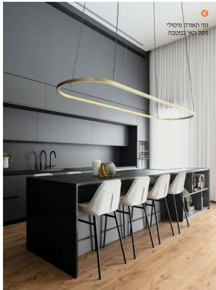
גוף תאורה פיסולי מעל האי במטבח