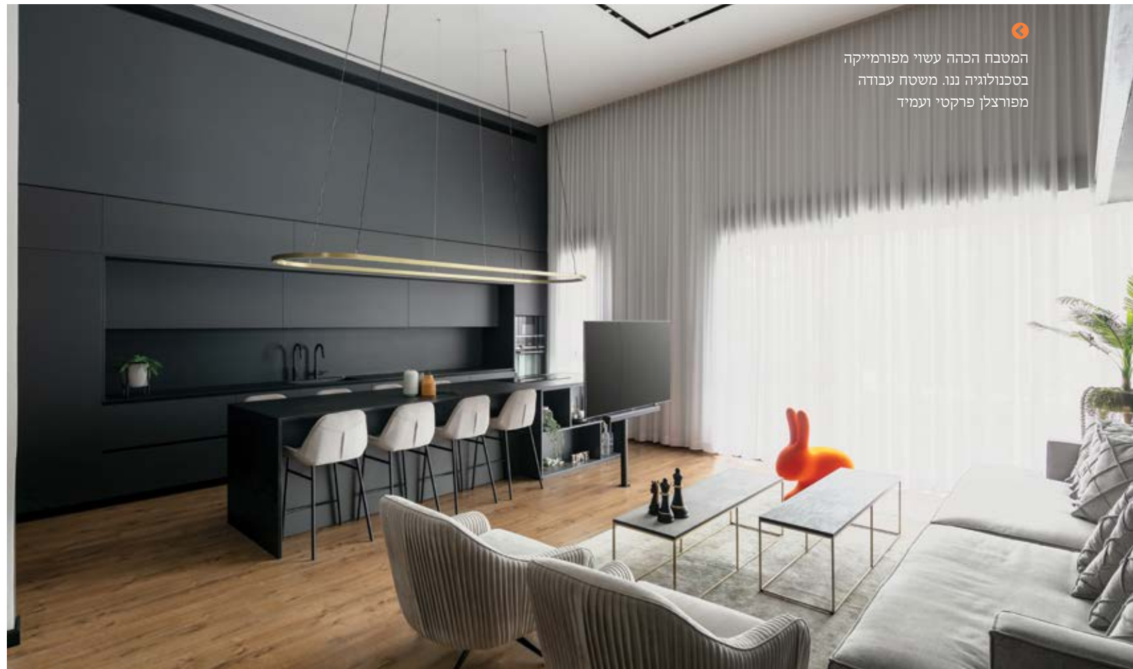
המטבח הכהה עשוי מפורמיקה בטכנולוגיה ננו. משטח עבודה מפורצלן פרקטי ועמיד