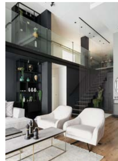
הטלוויזיה יושבת בבית על עמוד מסתובב, היא משתלבת בחלל ולא מפריעה לאווריריות של הסלון. באמצעות העמוד נוצר חלל פתוח, וגם השוהים במרפסת יכולים ליהנות מהמסך הגדול