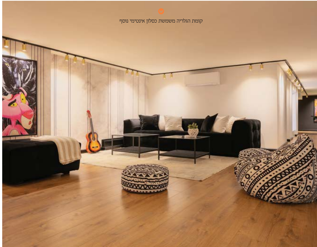
קומת הגלריה משמשת כסלון אינטימי נוסף