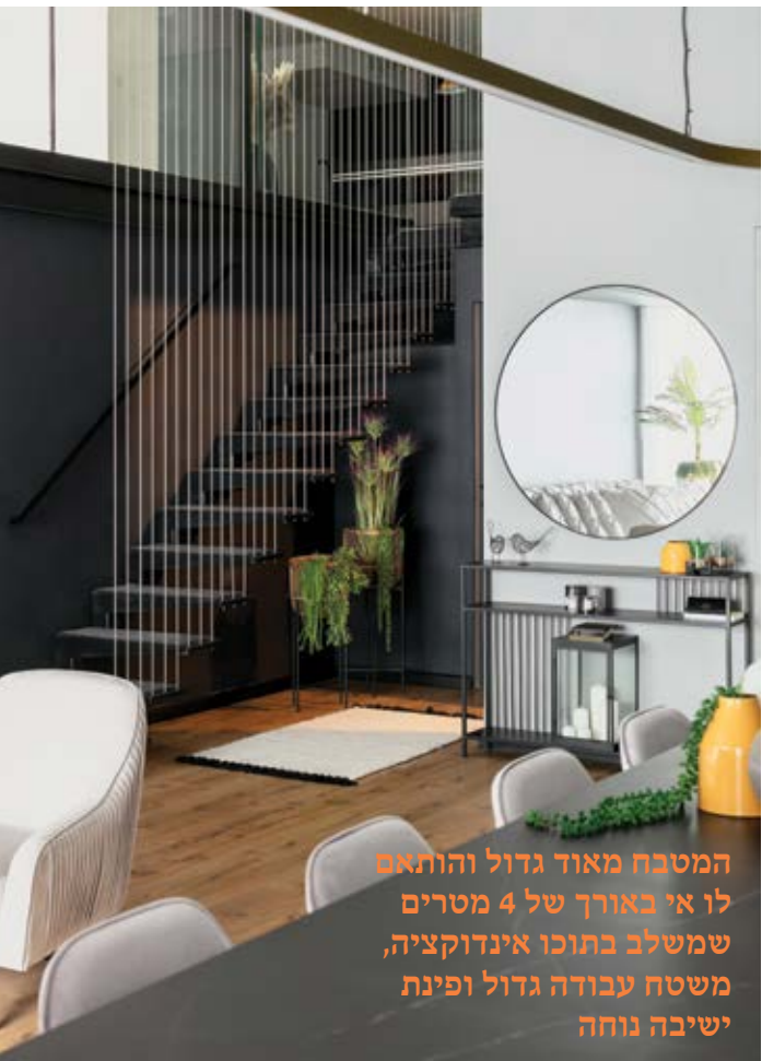
המטבח מאוד גדול והותאם לו אי באורך של 4 מטרים שמשלב בתוכו אינדוקציה, משטח עבודה גדול ופינת ישיבה נוחה